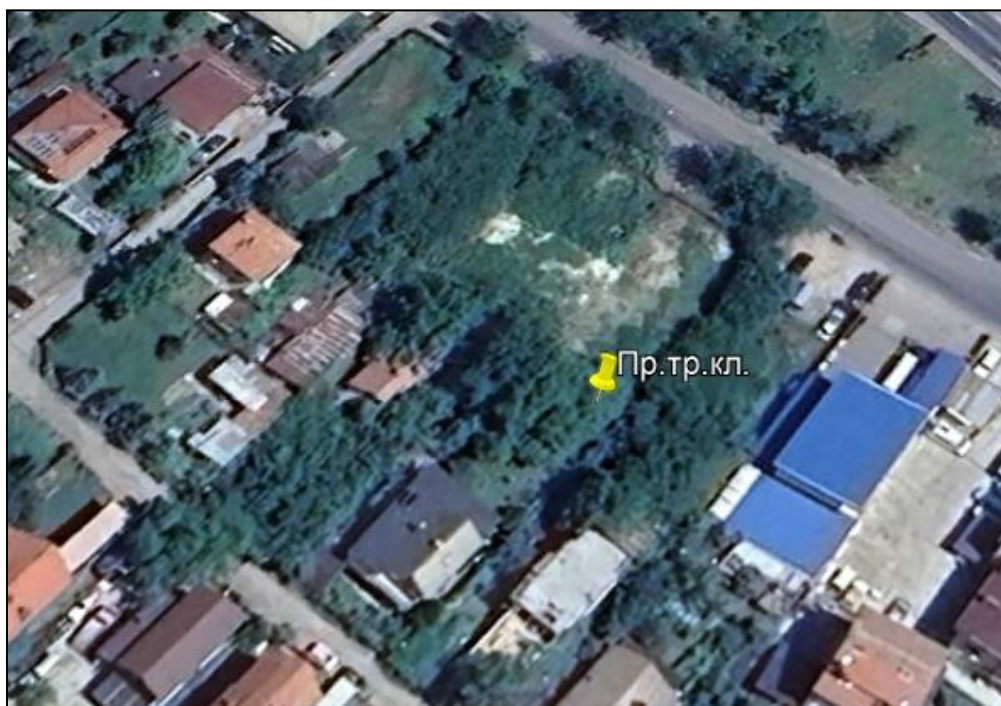
Фиг. 2. Местоположение на проектирания тръбен кладенец

Площта на имота е достатъчна за извършване на строителните работи и за временно съхранение на строителните отпадъци, формирани по време на строителството.