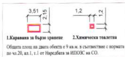
Сх.1. Размери на преместваемите обекти, М 1:500

СКИЦАТА НЕ СЛУЖИ ЗА СНАБДЯВАНЕ С НОТАРИАЛЕН АКТ И ЗА ИЗВЪРШВАНЕ НА СДЕЛКИ